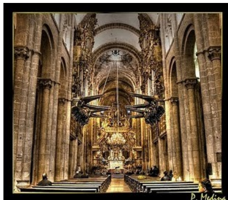
CATEDRAL DE SANTIAGO DE COMPOSTELA

(Pincha aquí para entrar en la página web de la catedral)