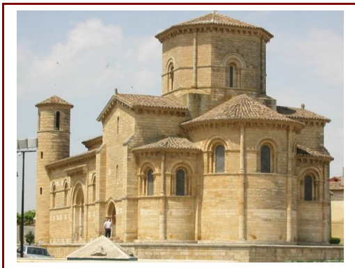
San Martín de Frómista

En torno a las rutas de los peregrinos se levantaron algunos principales templos y monasterios, buen ejemplo de ello son los que se levantan a lo largo del Camino de Santiago: